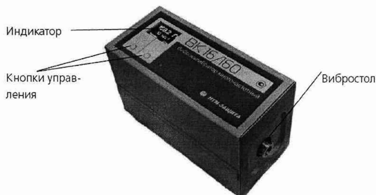
Рисунок 1. Виброкалибратор многочастотный «ВК 16/160»

1.4.4. Управление работой калибратора осуществляется кнопками на верхней панели, рисунок 1.