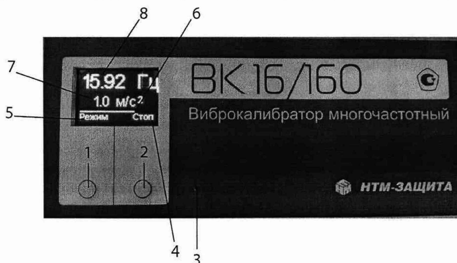
Рисунок 2. Назначение кнопок управления и содержание экрана индикатора. 1 – кнопка включения/выключения и переключения режимов; 2 – кнопка запуска и остановки воспроизведения колебаний; 3 – контрольный светодиод зарядки аккумуляторов; 4,5 – текущее назначение кнопок; 6 – индикатор времени воспроизведения колебаний; 7 – СКЗ ускорения установленного режима; 8 – частота колебаний установленного режима.