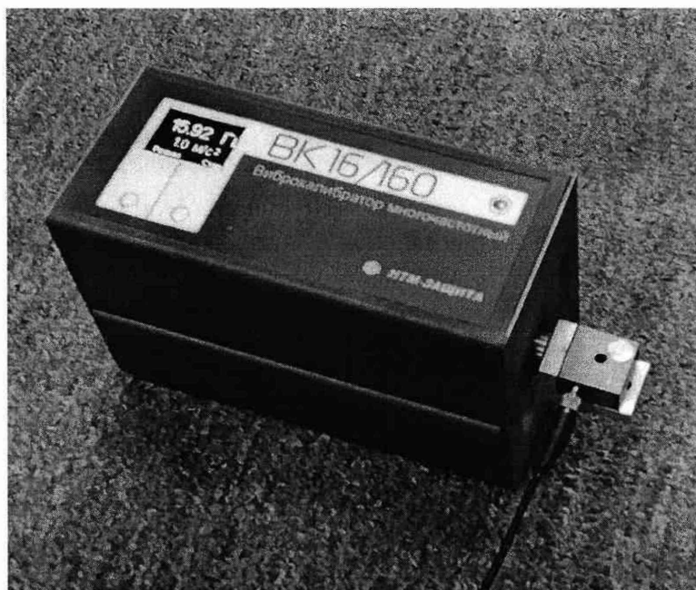
Рисунок 5. Использование углового адаптера.