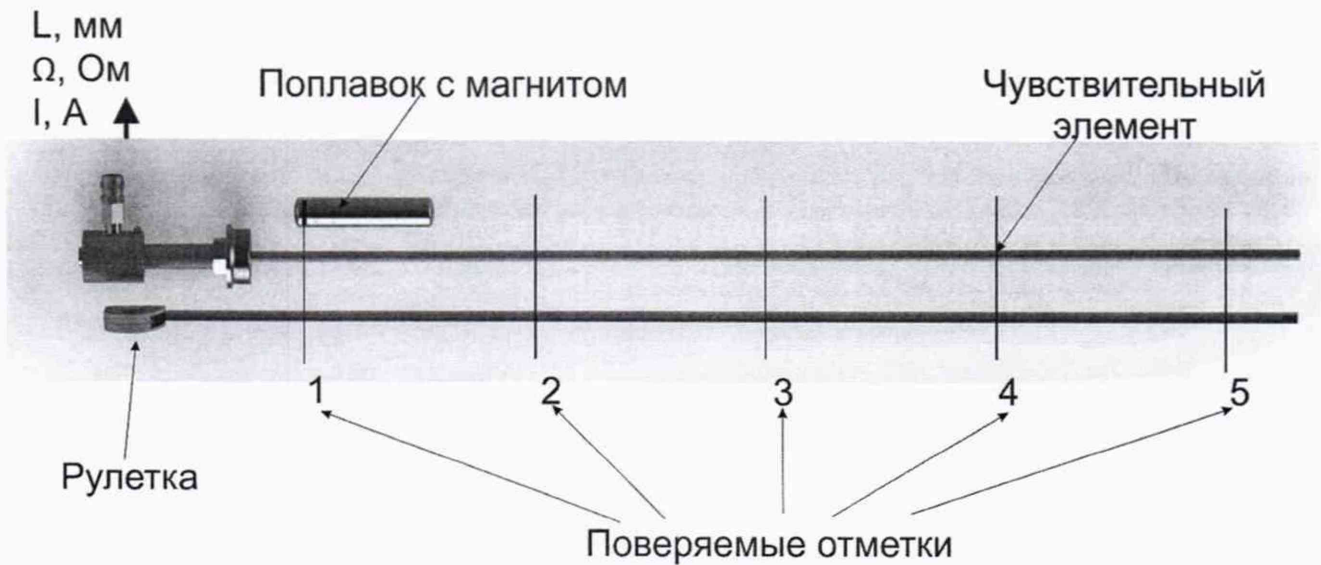
Рисунок 3 – Проверка уровнемера с помощью рулетки и магнитного поплавка