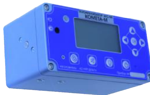
Рисунок 18 – Общий вид газоанализаторов ИГС-98 Модификации «Комета-М» исп.008