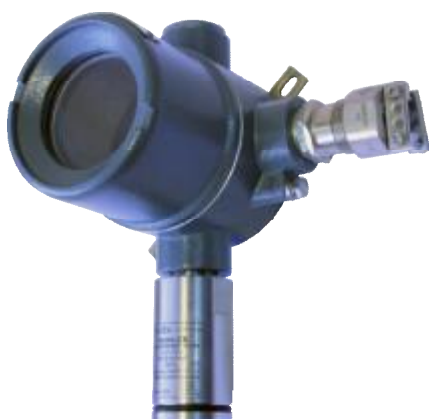
Рисунок 3– Общий вид газоанализаторов ИГС-98 Модификации «Астра-СВ» исп.023