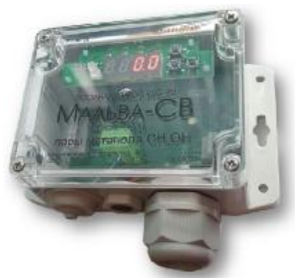
Рисунок 2 – Общий вид газоанализаторов ИГС-98 Модификации «Мальва-СВ» исп.011