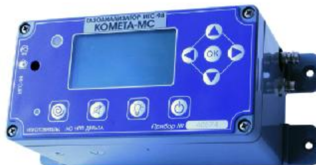
Рисунок 10 – Общий вид газоанализаторов ИГС-98 Модификации «Комета-МС» исп.014