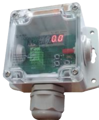
Рисунок 14 – Общий вид газоанализаторов ИГС-98 Модификации «Марш-Д» исп.009