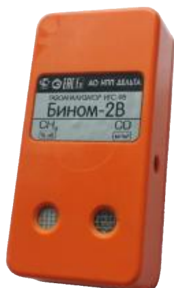
Рисунок 11 – Общий вид газоанализаторов ИГС-98 Модификации «Бином-2В» исп.004