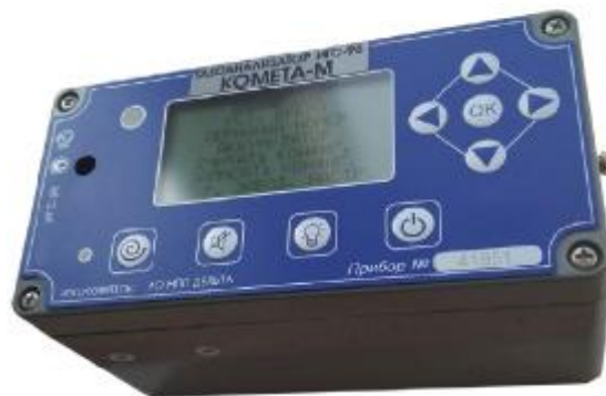
Рисунок 8 – Общий вид газоанализаторов ИГС-98 Модификации «Комета-М» исп.005