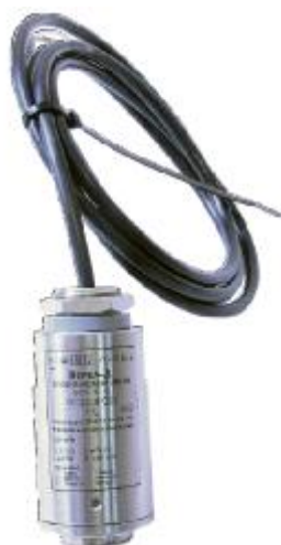
Рисунок 7 – Общий вид газоанализаторов ИГС-98 Модификации «Верб-Д» исп.014