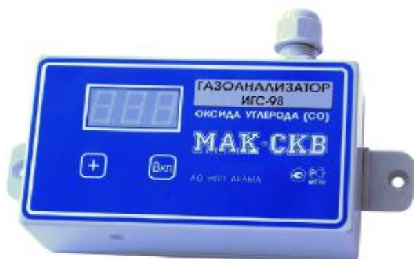
Рисунок 9 – Общий вид газоанализаторов ИГС-98 Модификации «Мак-СКВ» исп.009