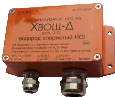
Рисунок 15 – Общий вид газоанализаторов ИГС-98 Модификации «Хвощ-Д» исп.010