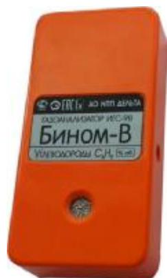
Рисунок 1 – Общий вид газоанализаторов ИГС-98 Модификации «Бином-В» исп.001

Общий вид газоанализаторов приведен на рисунках 1 – 18.