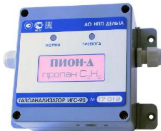
Рисунок 6 – Общий вид газоанализаторов ИГС-98 Модификации «Пион-Д» исп.005