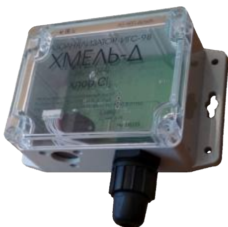
Рисунок 13 – Общий вид газоанализаторов ИГС-98 Модификации «Хмель-Д» исп.024