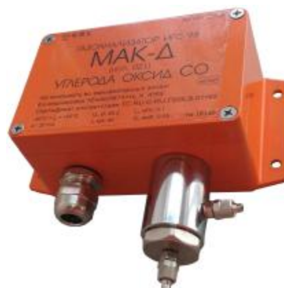
Рисунок 4 – Общий вид газоанализаторов ИГС-98 Модификации «Мак-Д» исп.021