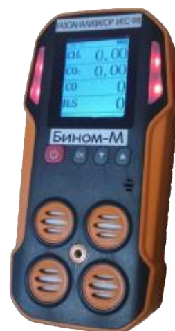
Рисунок 12 – Общий вид газоанализаторов ИГС-98 Модификации «Бином-М» исп.006