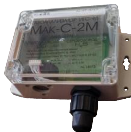
Рисунок 16 – Общий вид газоанализаторов ИГС-98 Модификации «Мак-С-2М» исп.026