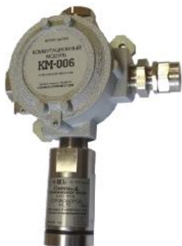
Рисунок 5 – Общий вид газоанализаторов ИГС-98 Модификации «Сирень-Д» исп.025