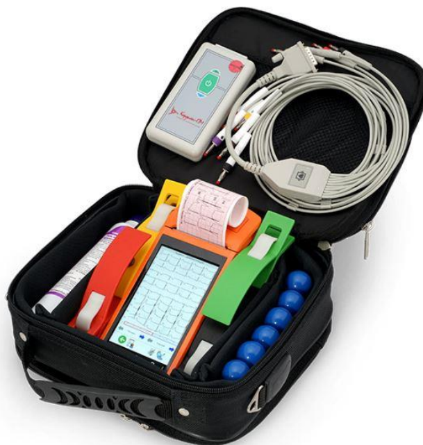
Рисунок 1 – Общий вид комплекса оперативного контроля электрокардиограмм «КАРДИАН ПМ»

Общий вид комплекса оперативного контроля электрокардиограмм «КАРДИАН ПМ» представлен на рисунке 1.