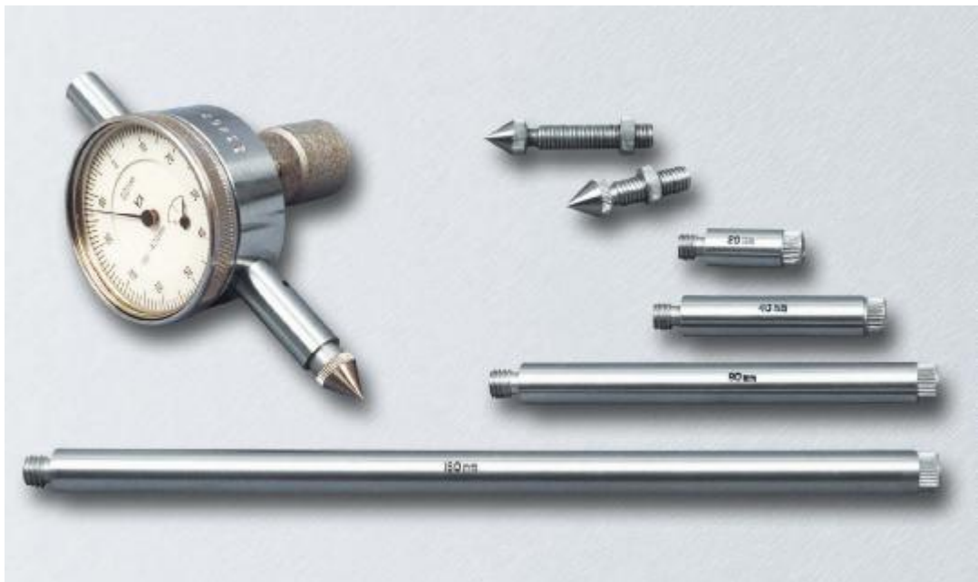
Рисунок 1 - Общий вид прибора НТИ

Общий вид средства измерений представлен на рисунке 1