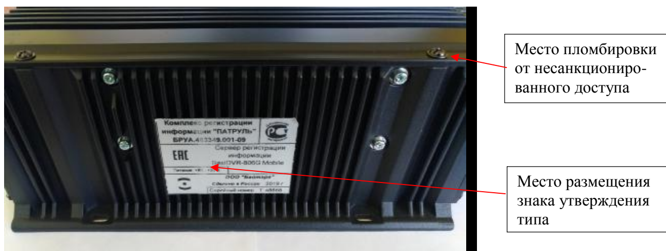
Рисунок 2 - Места нанесения знака утверждения типа и пломбировки от несанкционированного доступа комплекса