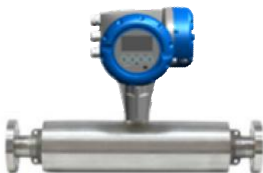
в) OPTIMASS 1400C