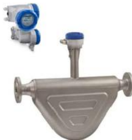
и) OPTIMASS 6400F