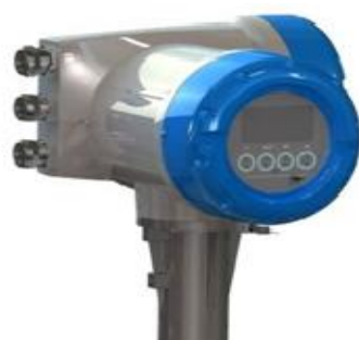
а) MFC 400C

Пломбировка расходомеров-счетчиков массовых OPTIMASS 1400, OPTIMASS 2400, OPTIMASS 6400 представлена на рисунках 2.1 и 2.2.