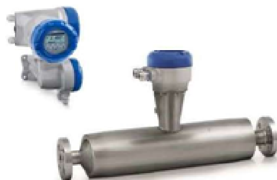
г) OPTIMASS 1400F