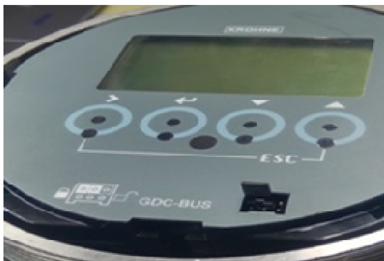
Рисунок 2.1 – Установка перемычки.