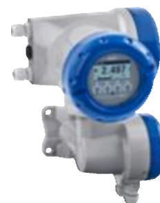
б) MFC 400F