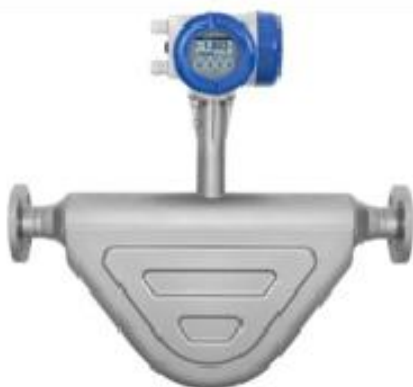
ж) OPTIMASS 6400C