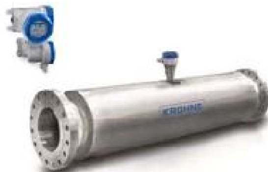
е) OPTIMASS 2400F