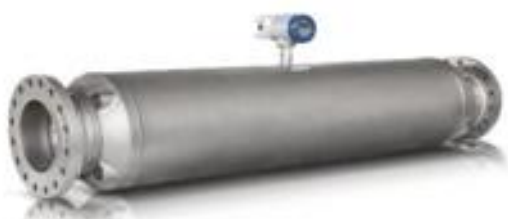
д) OPTIMASS 2400C