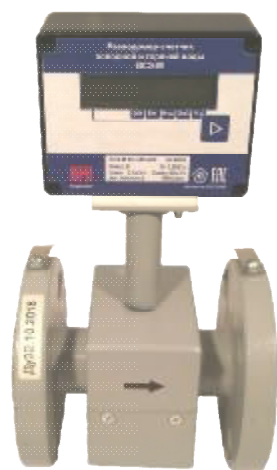
ВСЭ М И

- ВСЭ М БИ- состоит из преобразователя и электронного блока, ЖК индикатор отсутствует. Для отображения состояния расходомера-счетчика, предусмотрены светодиодные индикаторы.