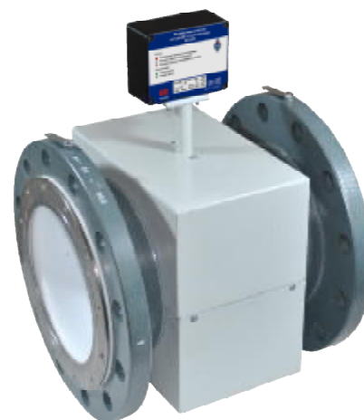
ВСЭ М БИ