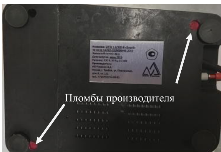
Рисунок 3 – Место нанесения пломбы производителя