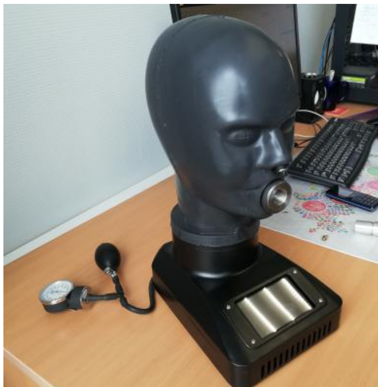
Рисунок 1 – Общий вид преобразователей расхода газа БППВ 1.0/300 Ф «Борей»