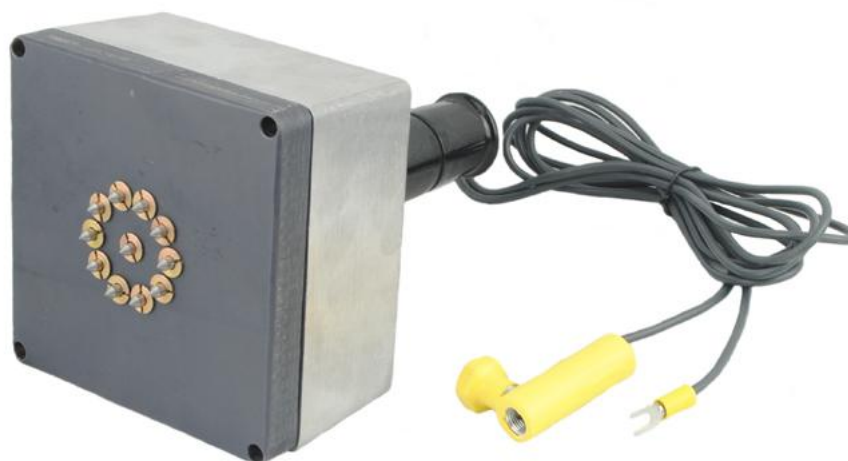
Рисунок 5 – Внешний вид датчика для определения УЭС цилиндрических ниппелей