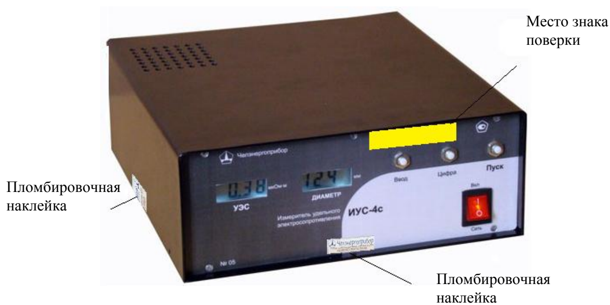
Рисунок 3 – Внешний вид измерителя ИУС-4с с местами пломбирования и местом нанесения знака поверки