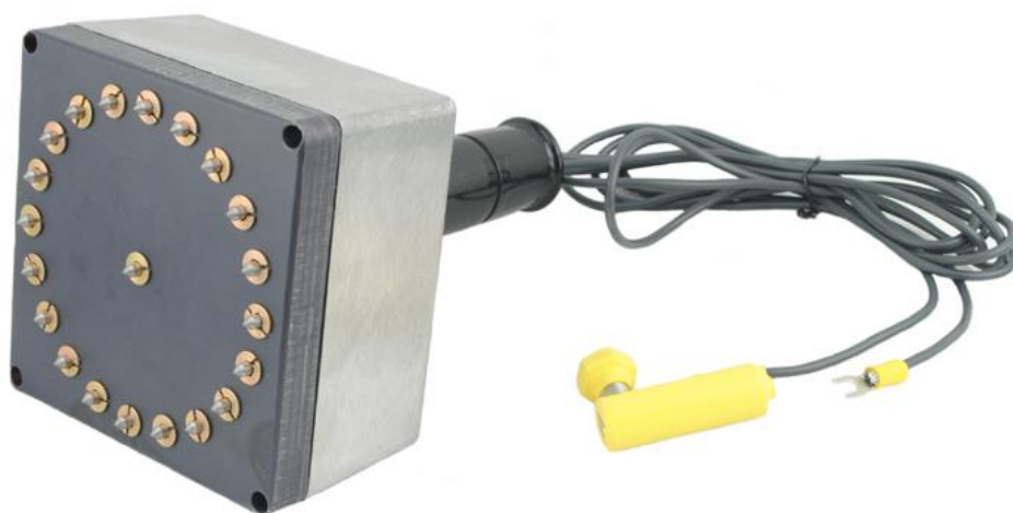
Рисунок 4 – Внешний вид датчика для определения УЭС биконических ниппелей