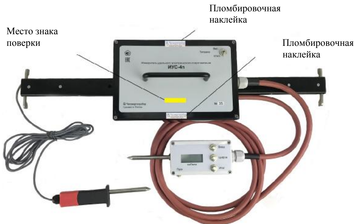
Рисунок 2 – Внешний вид измерителя ИУС-4п с местами пломбирования и местом нанесения знака поверки

Внешний вид измерителя ИУС-4п, места пломбирования и место нанесения знака поверки приведены на рисунке 2. Внешний вид измерителя ИУС-4с, места пломбирования и место нанесения знака поверки приведены на рисунке 3, внешний вид датчиков для измерения УЭС ниппелей – на рисунках 4 и 5.