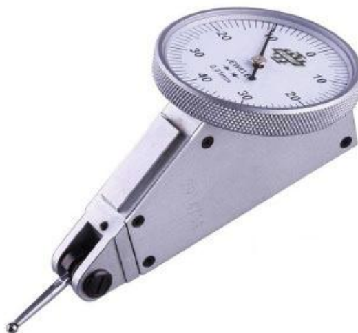
Рисунок 7 –Общий вид индикаторов типа ИРБУ