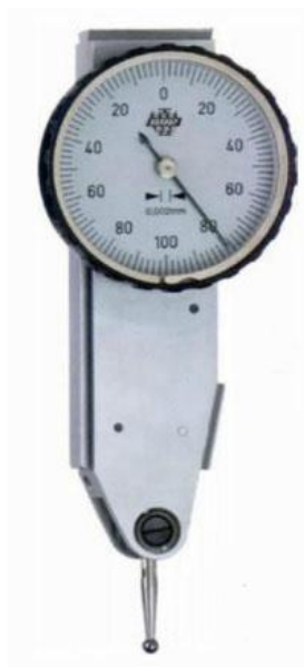
Рисунок 6 – Общий вид индикаторов типа ИРБП