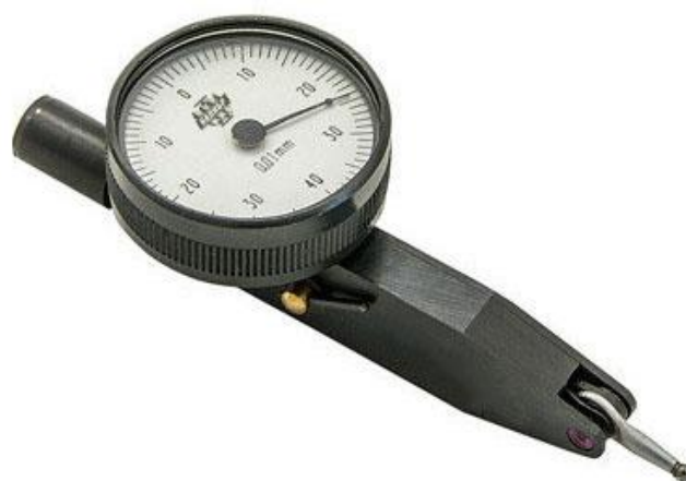
Рисунок 3 – Общий вид индикаторов типа ИРБг