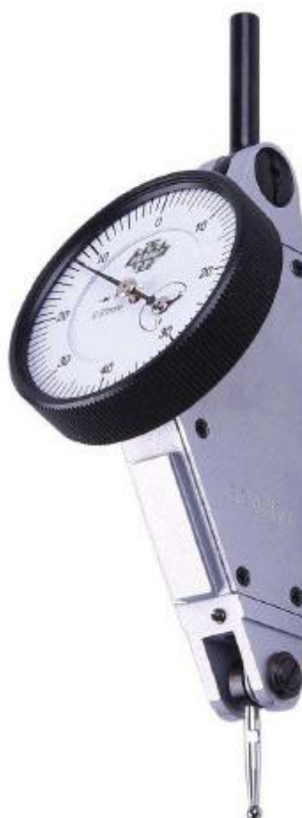
Рисунок 8 – Общий вид индикаторов типа ИРБУ