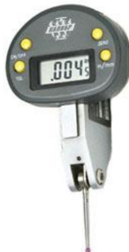
Рисунок 9 – Общий вид индикаторов типа ИРБЦ

Пломбирование индикаторов не предусмотрено.