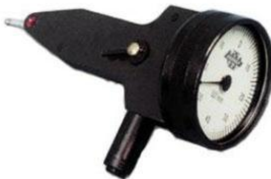
Рисунок 5 – Общий вид индикаторов типа ИРТг