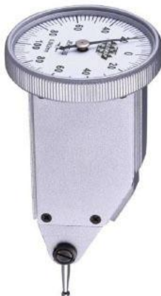
Рисунок 4 – Общий вид индикаторов типа ИРТ