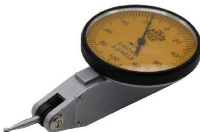
Рисунок 1 – Общий вид индикаторов типа ИРБ