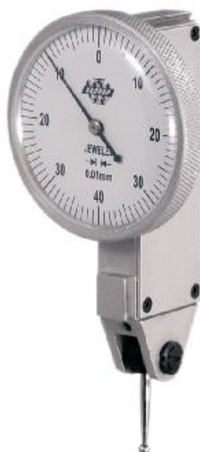
Рисунок 2 – Общий вид индикаторов типа ИРБ