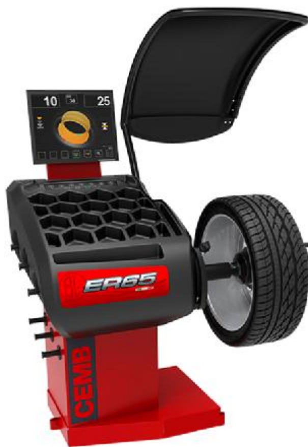
Рисунок 14 - Общий вид станков ER65