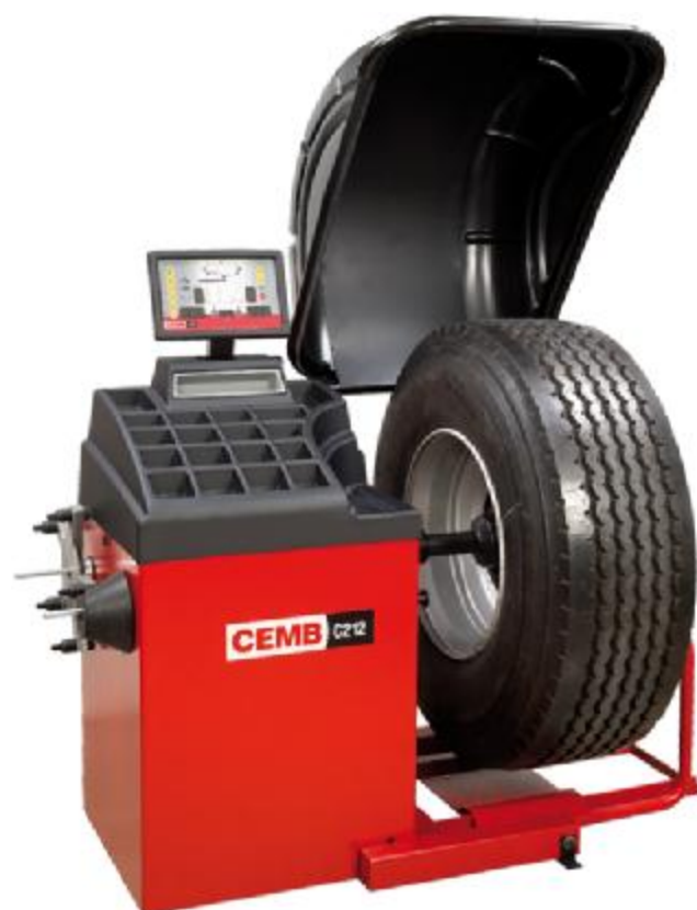
Рисунок 6 - Общий вид станков C212