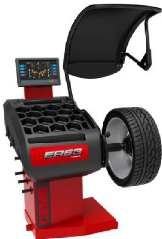
Рисунок 13 - Общий вид станков ER63SE