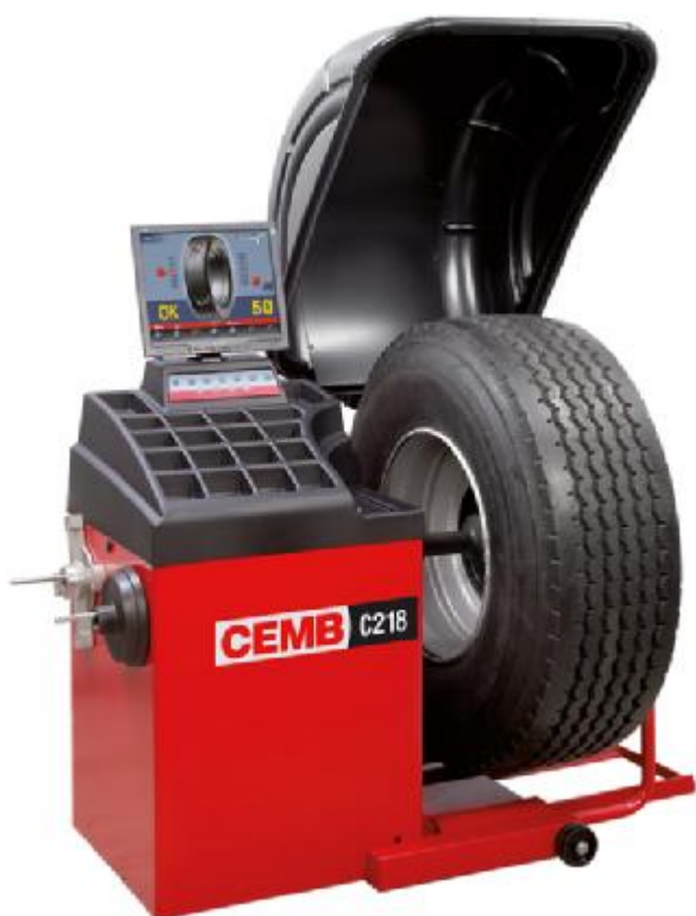
Рисунок 7 - Общий вид станков C218