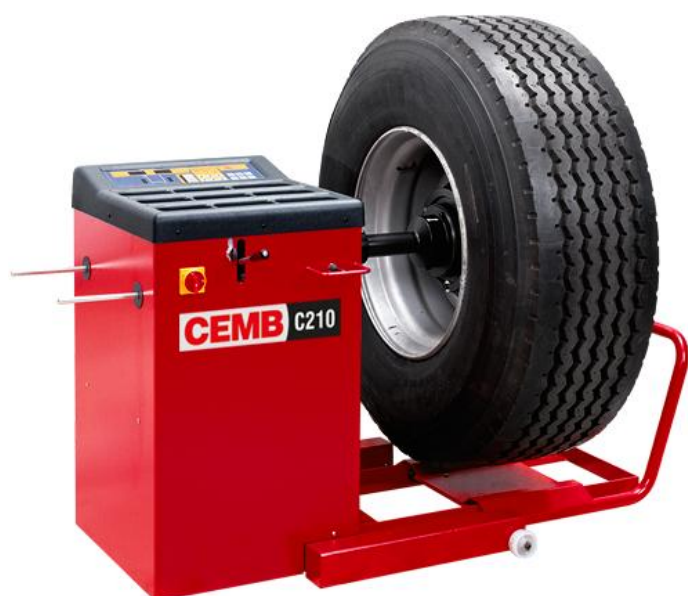
Рисунок 5 - Общий вид станков C210