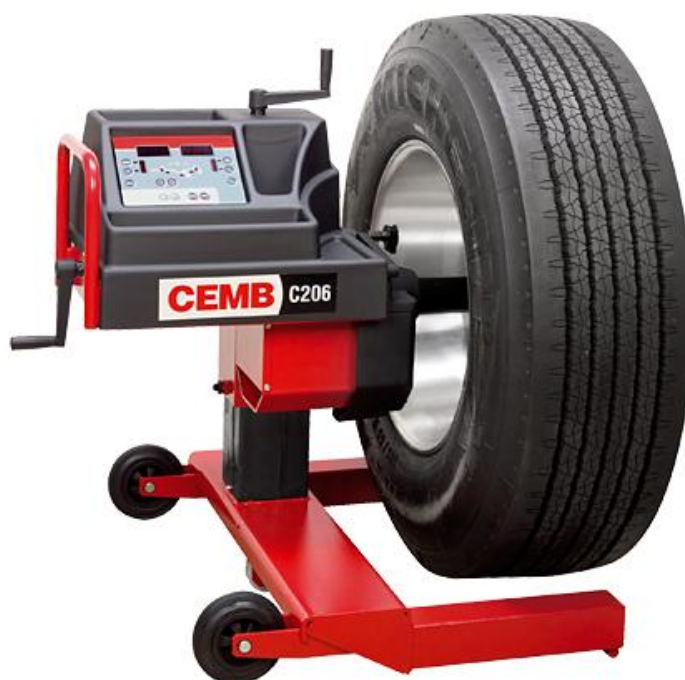
Рисунок 4 - Общий вид стендов C206