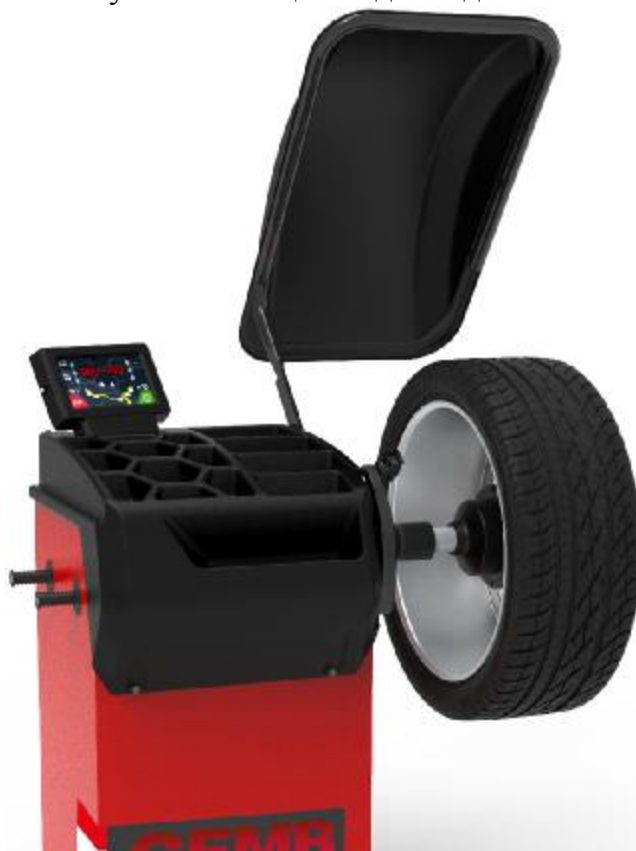
Рисунок 8 - Общий вид станков ER10