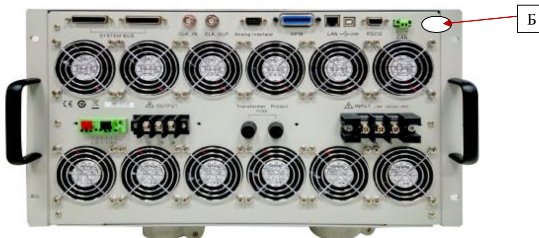
Рисунок 3 – Схема пломбировки от несанкционированного доступа (Б)