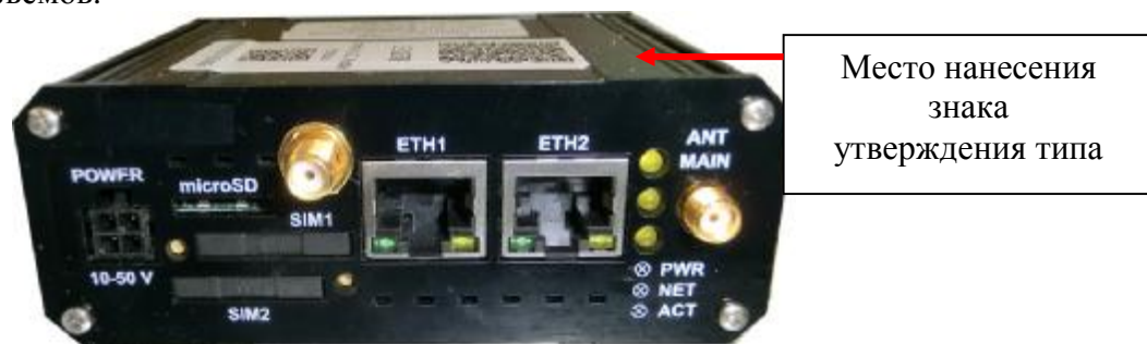
Рисунок 1 – Общий вид УСПД КМ ЭНТЕК

На рисунке 1 представлен общий вид УСПД КМ ЭНТЕК E2R2 (G), на рисунке 2 показан вид контактов и разъемов.