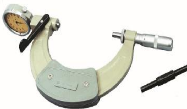
Рисунок 1 - Общий вид микрометров рычажных МРИ 125 - МРИ 150

Микрометры рычажные выпускаются в следующих модификациях: МРИ 125, МРИ 150, МРИ 200, МРИ 250, МРИ 300, МРИ 400, МРИ 500, МРИ 1200, МРИ 1400, МРИ 1600, МРИ 1800, МРИ 2000, которые отличаются друг от друга диапазонами измерений, ценой деления отсчетного устройства, нормируемой погрешностью, габаритными размерами и массой.