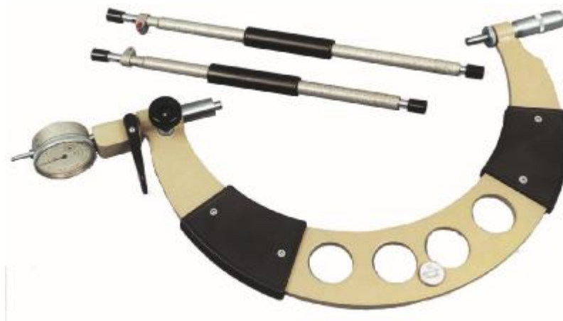
Рисунок 2 - Общий вид микрометров рычажных МРИ 200 - МРИ 500