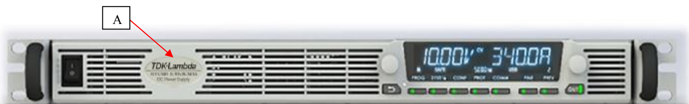
Рисунок 2 – Общий вид источников стандартного исполнения мощностью 1000, 1700, 2700 и 3400 Вт, место нанесения знака утверждения типа (А)