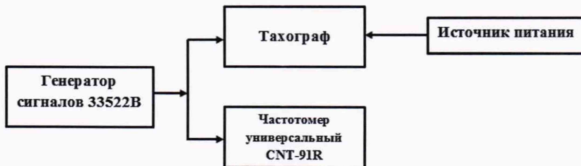
Рисунок 2 – Схема проведения измерений при определении абсолютной погрешности измерений интервала времени и абсолютной инструментальной погрешности измерений пройденного пути

8.3.1 Собрать схему в соответствии с рисунком 2.