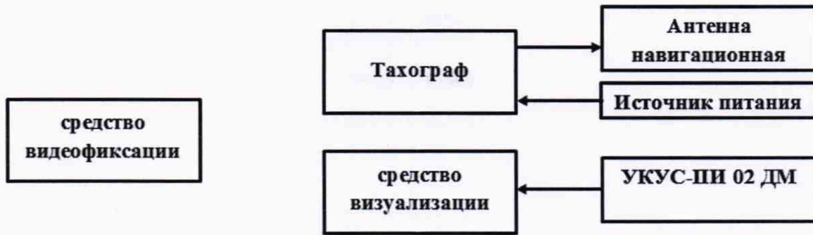
Рисунок 5 - Схема проведения измерений при определении абсолютной погрешности синхронизации шкалы времени внутреннего опорного генератора тахографа со шкалой времени блока СКЗИ

8.10.2 Обеспечить радиовидимость сигналов навигационных космических аппаратов ГЛОНАСС и GPS в верхней полусфере. В соответствии с эксплуатационной документацией на тахограф и УКУС-ПИ 02ДМ подготовить их к работе. Настроить УКУС-ПИ 02ДМ на выдачу шкалы времени, синхронизированной с национальной шкалой координированного времени UTC(SU).