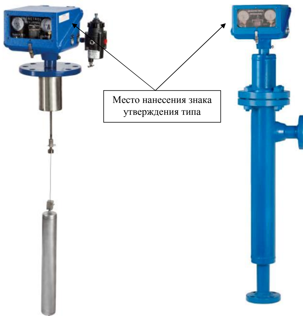
Рисунок 1 – Общий вид уровнемеров и место нанесения знака утверждения типа