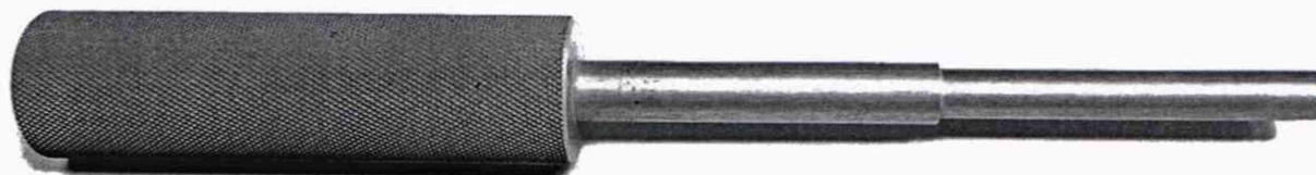
Рисунок Б.1 – Внешний вид цилиндрической оправки (мандрели)