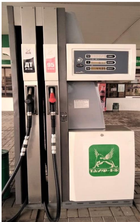
Исполнение BMP 2024SH V

Общий вид колонки приведен на рисунке 1, места пломбирования на рисунках 2 – 3.