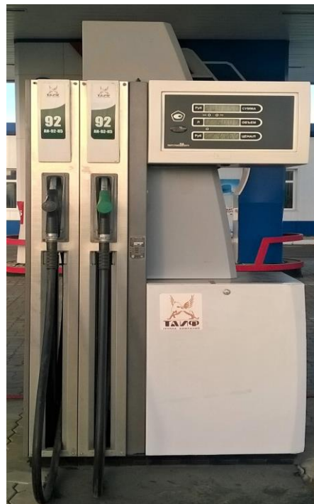
Исполнение BMP 2024SH E