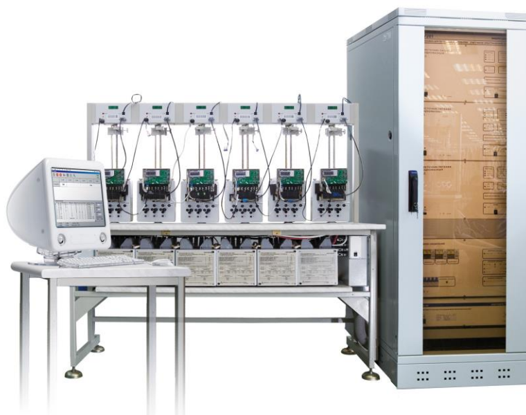
Рисунок 1 – Трехфазная установка СУ201М-3 с одним стендом

Пломбировка трансформаторов тока гальванической развязки ТТГР-М100/100 или ТТГР100/100, многофункциональных ваттметров-счетчиков СЕ603М1, при наличии в составе, осуществляется в соответствии с нормативно-технической документацией, распространяющейся на них.