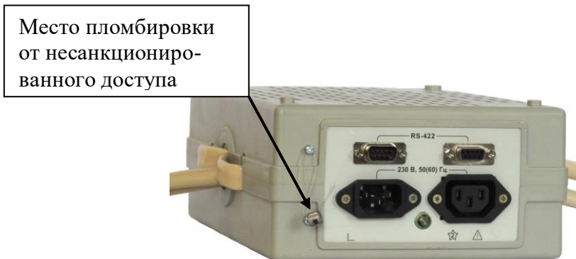
Рисунок 4 – Место пломбировки встроенных активных изолирующих трансформаторов тока