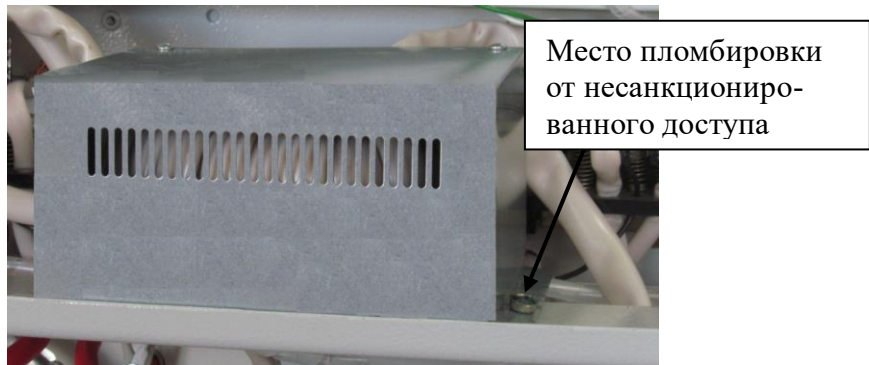
Рисунок 3 – Место пломбировки встроенных пассивных изолирующих трансформаторов тока