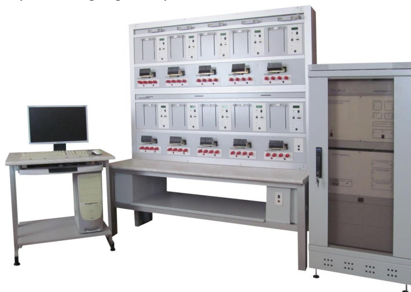
Рисунок 2 - Однофазная установка СУ201М-1 с одним стендом