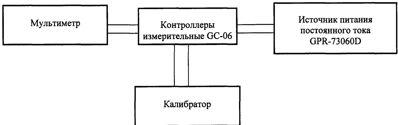
Рисунок 1 - Структурная схема определения погрешности измерений (преобразований)

1) подготовить к работе калибратор универсальный 9100 (далее - калибратор), мультиметр 3458А (далее - мультиметр) и источники питания постоянного тока GPR-73060D (далее – источник питания) в соответствии с их эксплуатационной документацией, собрать схему, представленную на рисунке 1;