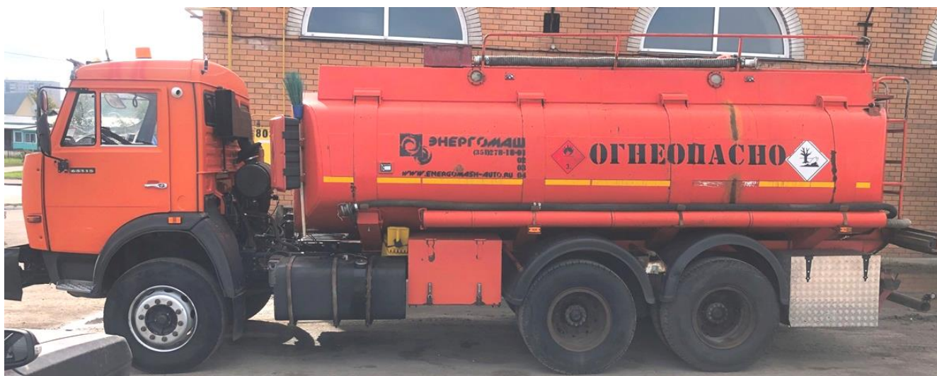
Рисунок 1 – Общий вид АЦ

Схема пломбировки от несанкционированного изменения положения указателя уровня налива, обозначение места нанесения знака поверки представлены на рисунке 2.