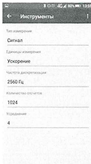
Рисунок 5 – Настройки виброметра.