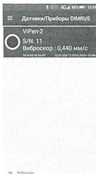
Рисунок 3 – Отображение виброметра «ViPen-2» № 11 в ПО «Беспроводные датчики DIMRUS».

6.4.4 В окне программы нажмите на строку с нужным серийным номером (рисунок 3) для проверки (изменения) настроек (рисунок 4).