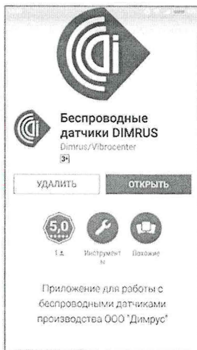
Рисунок 2 – ПО «Беспроводные датчики DIMRUS».

https://play.google.com/store/apps/details?id=com.dimrus.sensormanager