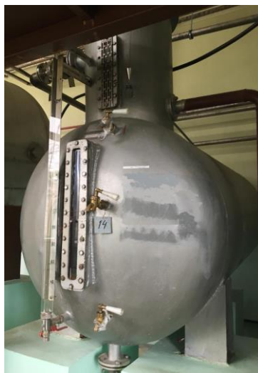
Рисунок 1 - Общий вид мерника М1кл, зав.№ 2851297