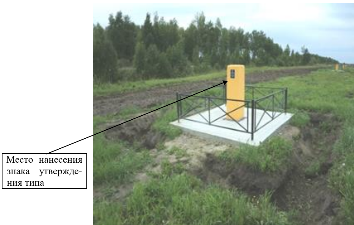
Рисунок 2 – Общий вид пункта № 1