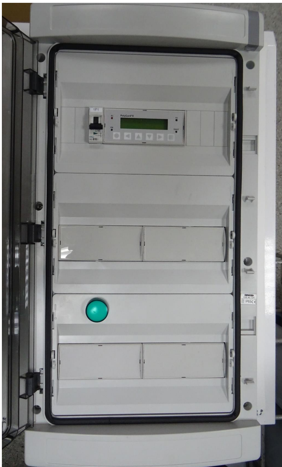
а) центральный блок

Внешний вид газоанализаторов и места пломбирования от несанкционированного доступа приведены на рисунке 1.