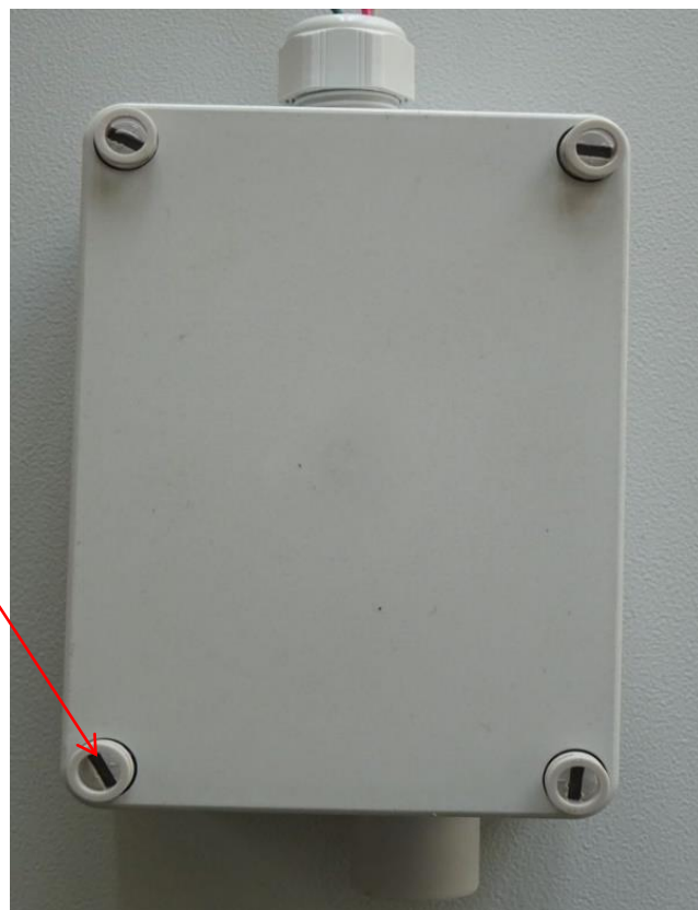
в) датчик PolyGard 2