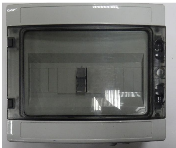
г) блок питания