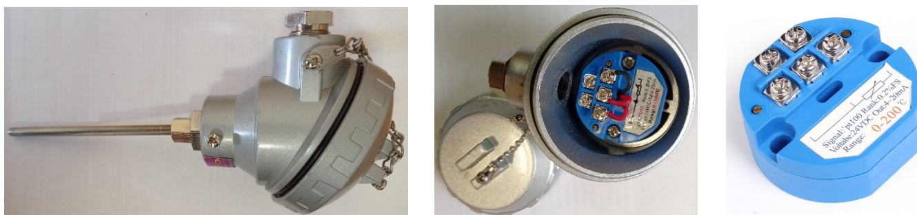
Рисунок 1 – Общий вид ПТИ и его составных частей

Защита от несанкционированного доступа с целью предотвращения несанкционированных настроек и вмешательства, которые могут привести к искажению результатов измерений осуществляется с помощью наклейки пломбированием шлицов