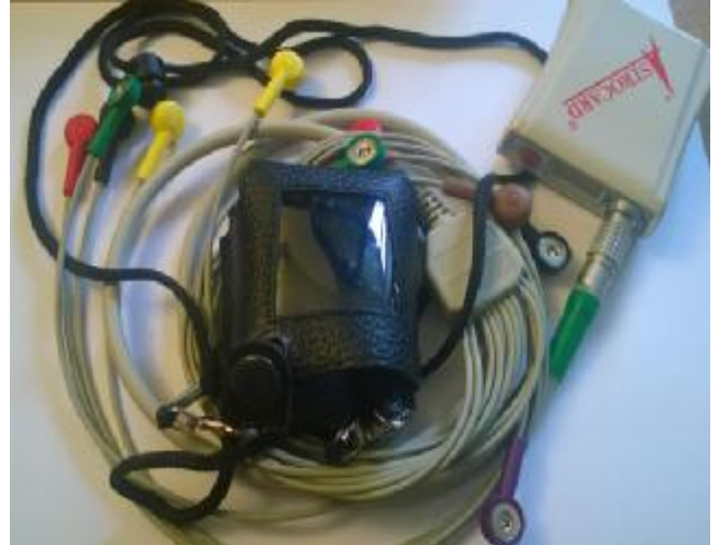
Рисунок 7. Регистраторы HE12N, HE12NA