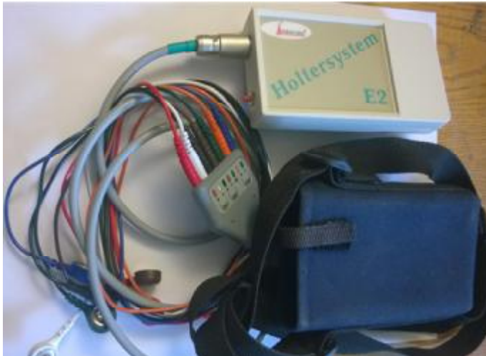
Рисунок 6. Регистратор HE2