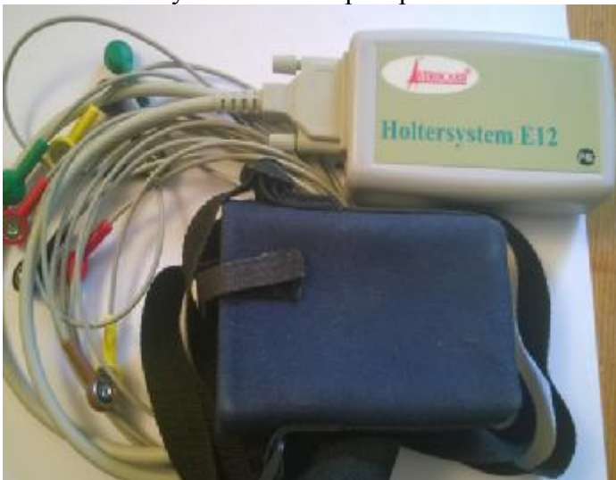
Рисунок 8. Регистратор HE12