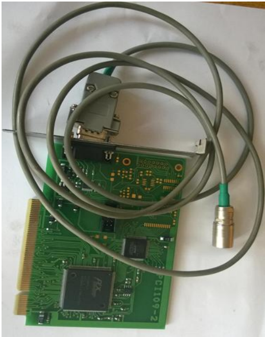
Рисунок 2. Интерфейсная плата и Кабель для соединения интерфейсной платы и регистратора