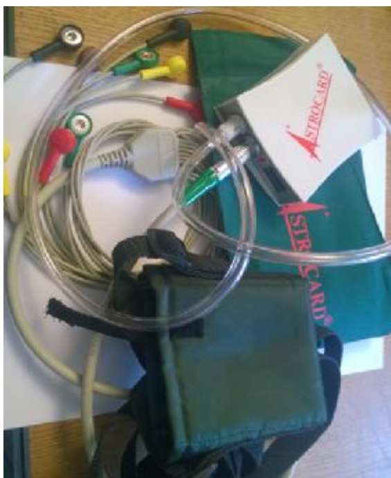
Рисунок 4. Регистраторы модели HE2BP, HE2BP_L, HE3BP, HE3BP_L, HE_BP, HE12_BP, HE12_BPA