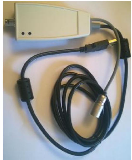
Рисунок 3. Адаптер для считывания регистраторов