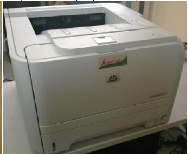
Рисунок 9. Принтер