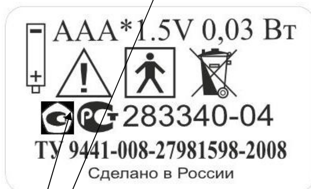
Место нанесения знака утверждения типа Рисунок 15 Макет этикетки регистраторов с питанием от элементов 1,5 В