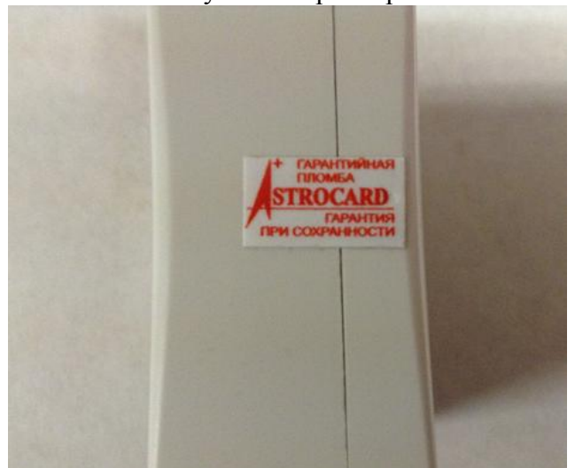
Рисунок 11. Защитная наклейка от несанкционированного доступа