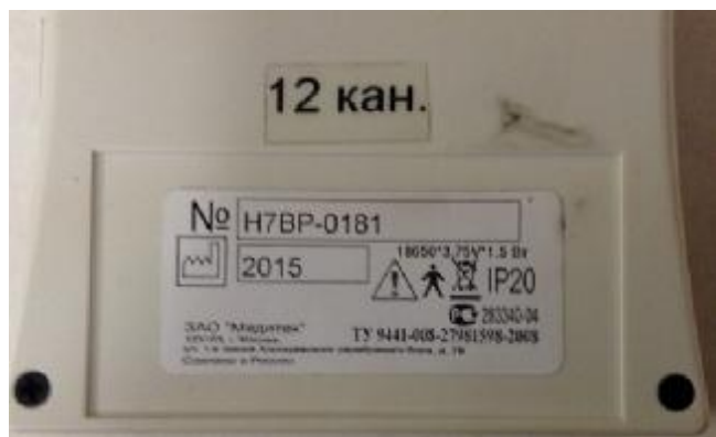
Рисунок 12. Фотография этикетки регистратора HE12_BPA