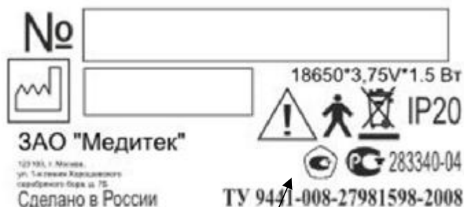
Рисунок 13 Макет этикетки регистраторов с питанием от батареи 3,75 В