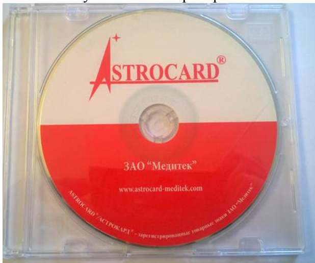
Рисунок 10. Диск с программным обеспечением