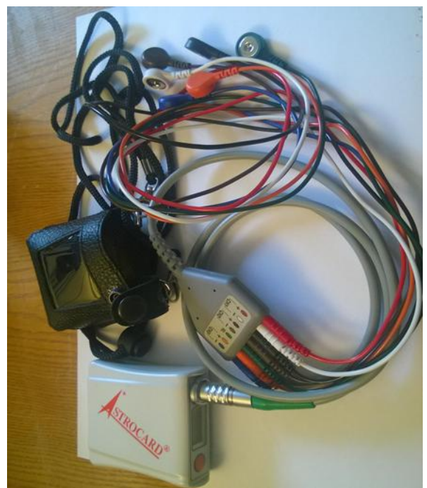
Рисунок 5. Регистраторы модели HE3, HE3A