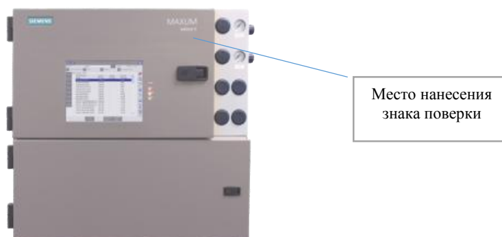
Рисунок 2 - Внешний вид хроматографов Махум edition II (исполнение 2)