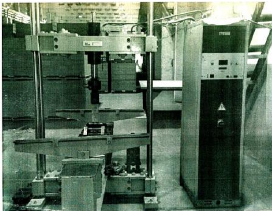
Рис. 2 – Установка модели 1229 для измерения нагрузки до 100 кН

Принцип действия установок основан на преобразовании давления в гидроцилиндре нагружающего устройства, пропорционального величине измеряемой силы, в электрический сигнал управления электрогидравлическим приводом.