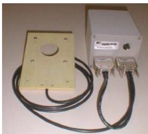
Рисунок 2 – Внешний вид измерительной катушки, подключенной к измерительному блоку ST-P-L

Гистерезисграфы позволяют проводить измерения образцов при нагреве до заданной температуры при установке полюсных наконечников электромагнита с нагревательными элементами.