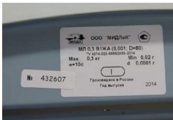
Рисунок 2 – Маркировочная табличка весов

Обозначение модификаций весов имеет следующий вид: