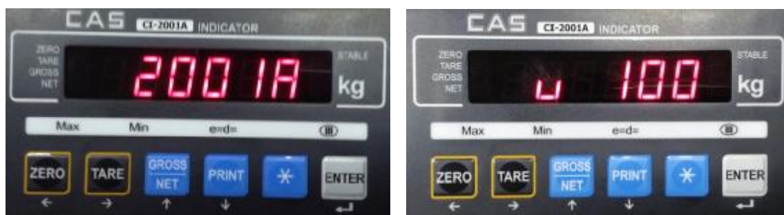
Рисунок 5 – Индикация версии ПО

Идентификация программы: после включения весов на индикаторе весов отображается идентификационное наименование ПО, затем номер версии ПО (Рисунок 5).