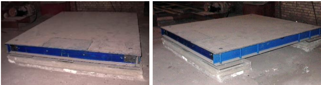
Рисунок 1 – Общий вид весоизмерительного устройства

Восемь модификаций весов отличаются максимальными, минимальными нагрузками, диапазонами взвешивания, пределами допускаемой погрешности, габаритными размерами и массой.