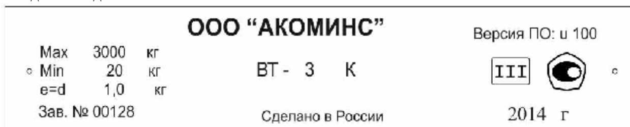
Рисунок 3 – Маркировка весов

Для защиты весов от несанкционированной настройки и вмешательства, которые могут привести к искажению результатов измерений, весы пломбируются изготовителем и поверителем. Схема пломбировки от несанкционированного доступа и обозначение мест для нанесения оттиска клейма приведена на рисунке 4.