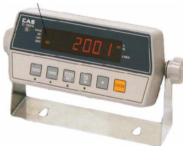
Рисунок 2 – Общий вид индикатора