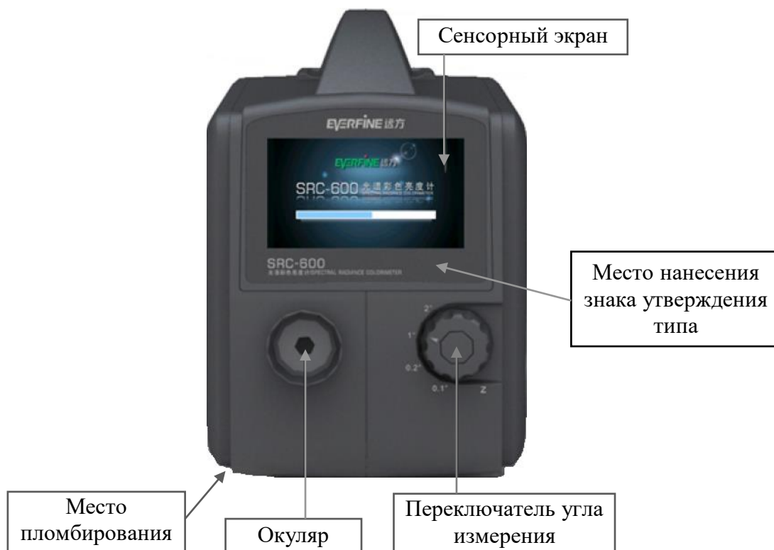
Рисунок 2 – Общий вид спектроколориметра SRC-600 (передняя панель) со схемой пломбировки от несанкционированного доступа