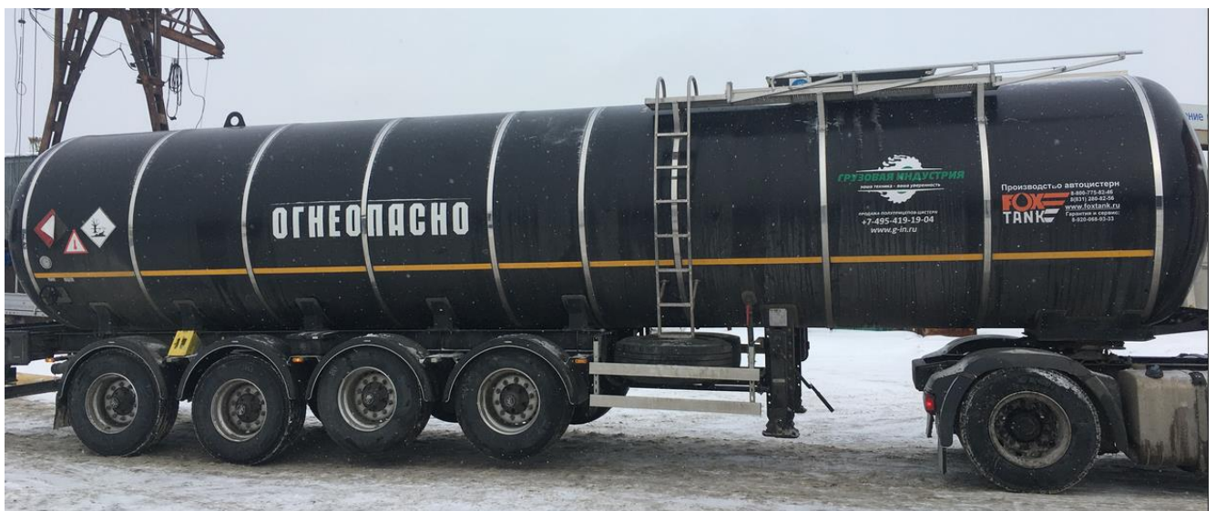
Рисунок 1 – Общий вид полуприцепа-цистерны 877721