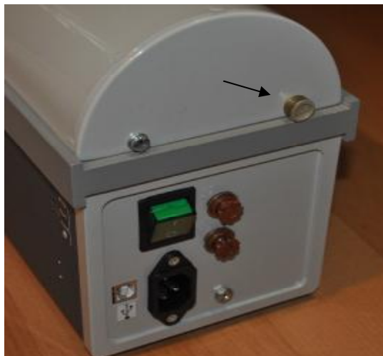
Рисунок 2 - Схема пломбирования крышки установок поверочных «ГВП Фантом-Спиро М»