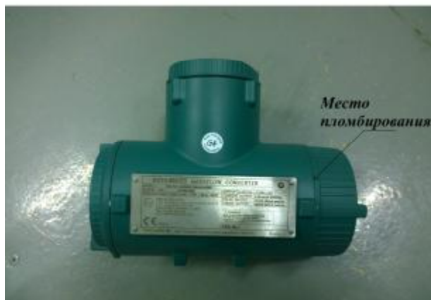
Рисунок 2 – Схема пломбирования счетчиков-расходомеров массовых кориолисовых ROTAMASS модификации RCCS31-RCCF31