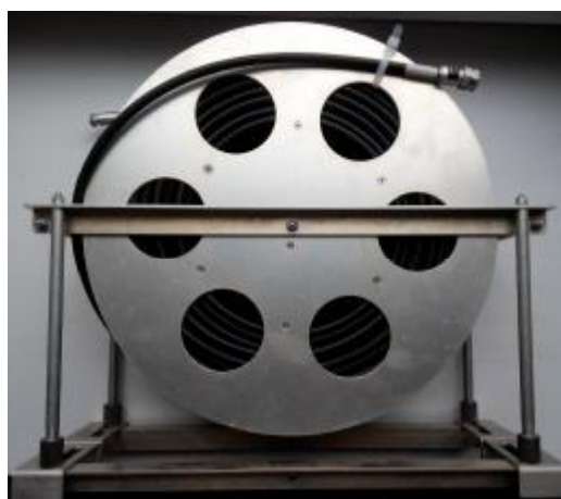
Рисунок 4 - Внешний вид кабеля антенны измерительной логопериодической АИЛ ИУШЯ.685661.142