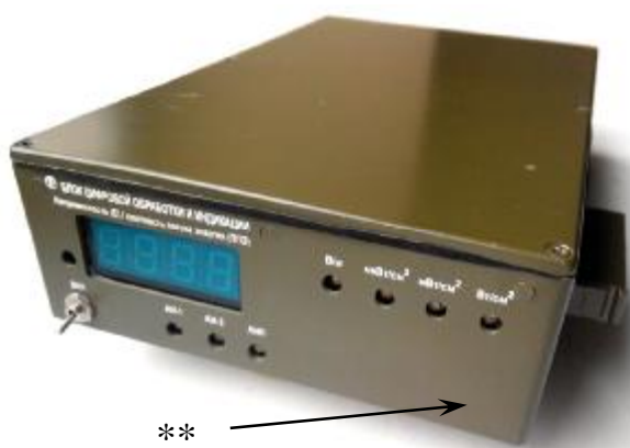
Рисунок 5 - Внешний вид блока цифровой обработки и индикации (вид спереди) ** - место для нанесения наклейки