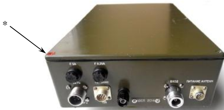
Рисунок 6 - Внешний вид блока цифровой обработки и индикации (вид сзади) * - место пломбировки от несанкционированного доступа