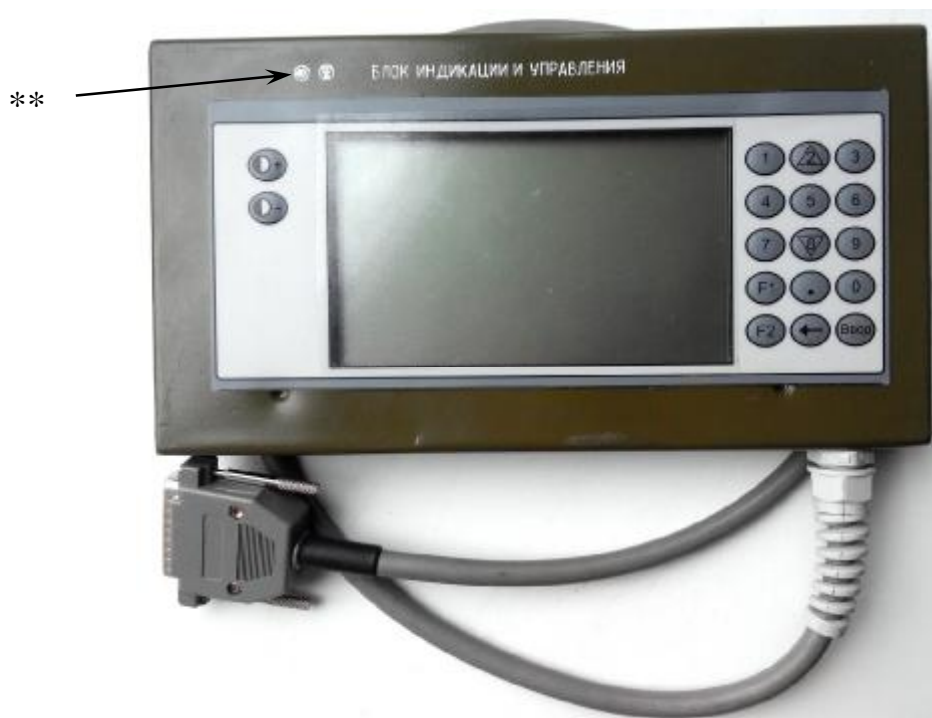
Рисунок 7 - Внешний вид блока индикации и управления ** - место для нанесения наклейки