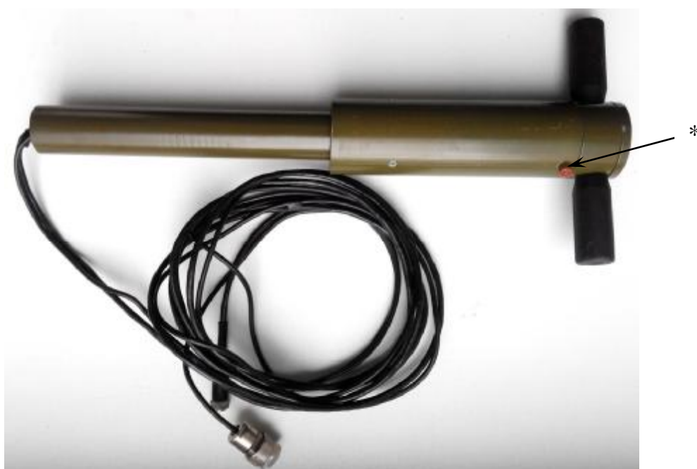
Рисунок 1 - Внешний вид антенны измерительной АИ-1 * - место пломбировки от несанкционированного доступа

Внешний вид элементов системы, места пломбировки от несанкционированного доступа и нанесения знака утверждения типа приведены на рисунках 1-7.