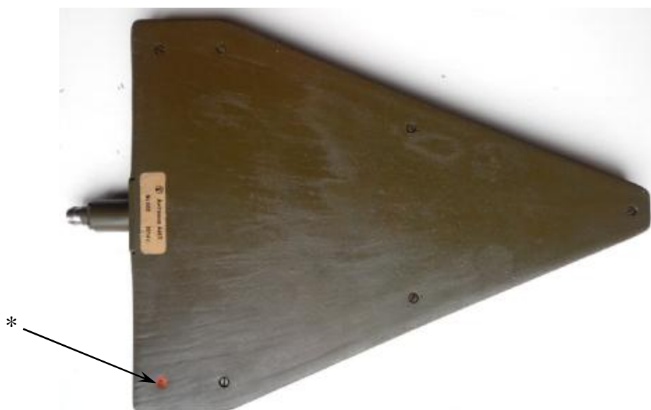
Рисунок 3 - Внешний вид антенны измерительной логопериодической АИЛ * - место пломбировки от несанкционированного доступа