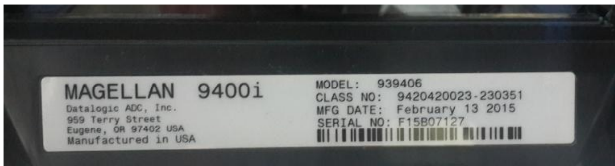
Рисунок 4 –Маркировка весов

Маркировка весов производится на фирменных наклейках, где указывается (Рис. 4):