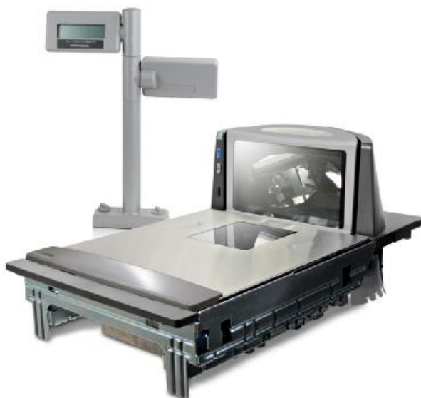
Рисунок 3 – Общий вид весов