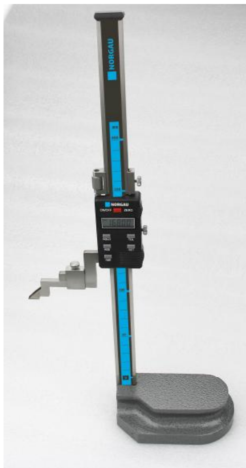
Рисунок 3 – Общий вид штангенрейсмасов серии 043 141