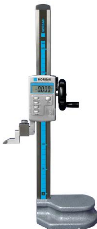
Рисунок 2 – Общий вид штангенрейсмасов серии 043 141