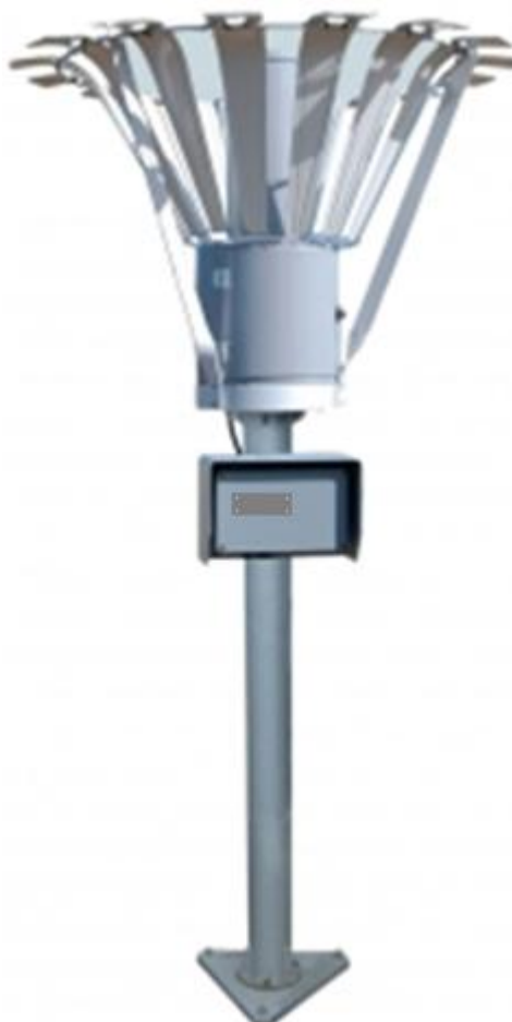
Рисунок 1 - Внешний вид датчика «Пеленг СФ-11»

Места пломбирования датчиков и нанесения знака поверки (клейма-наклейки) указаны на рисунке 2.