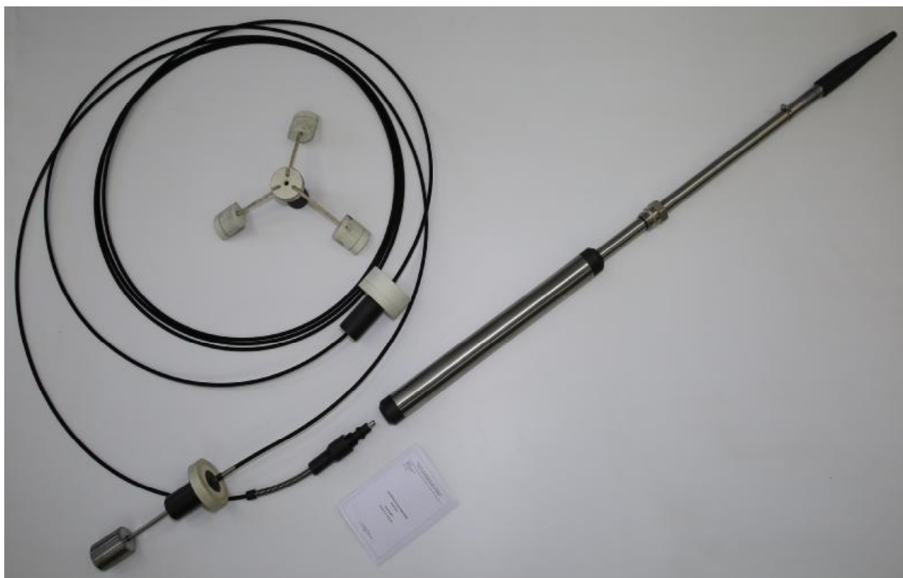
Рисунок 1 -Общий вид уровнемера «Сирень»

В уровнемерах с модулем интерфейса подключение, обмен с внешним устройством производится по интерфейсу RS-485. Принципиальное отличие от уровнемеров с беспроводным каналом связи – наличие модуля интерфейса и кабельное подключение к внешнему устройству.