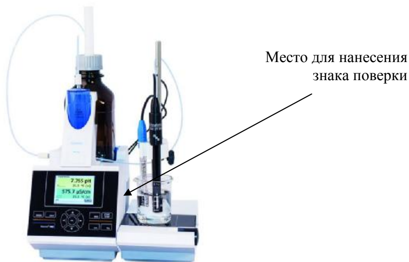
Рисунок 2 - Внешний вид титратора TitroLine 7800