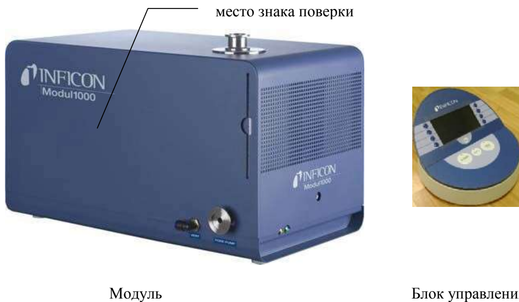
Рисунок 1 – Внешний вид течеискателя Modul1000