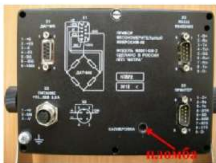
M0601 Пломба для нанесения знака поверки