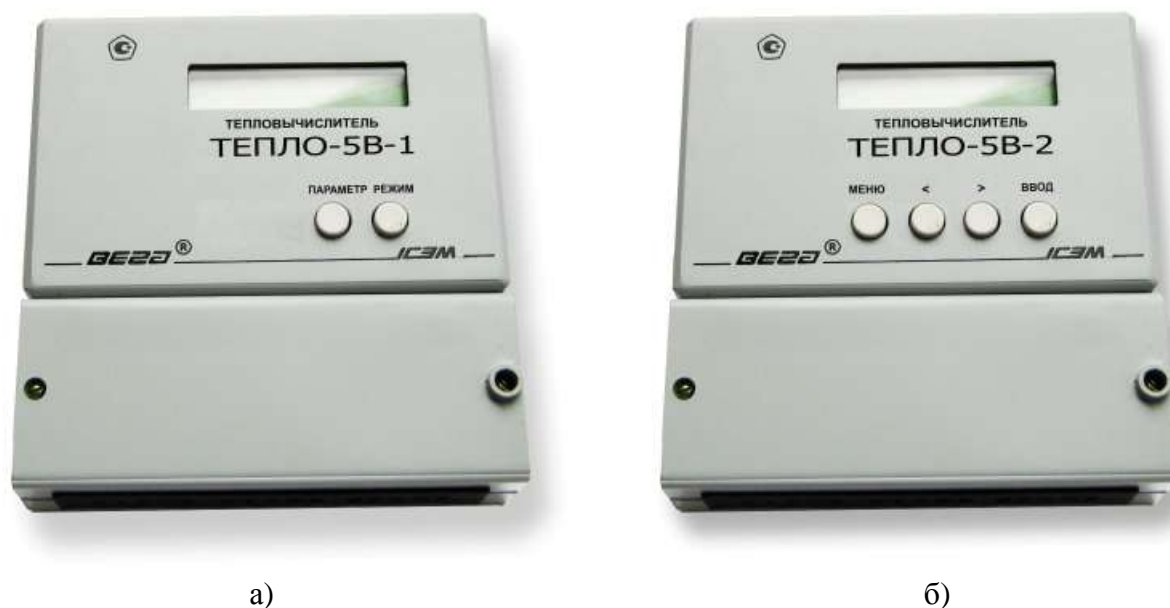
Рисунок 1 - Внешний вид тепловычислителя «Тепло-5В» а) исполнение «Тепло-5В-1»; б) исполнение «Тепло-5В-2»

Внешний вид «Тепло-5В» приведен на рисунке 1. Знак поверки наносится на место пломбирования на задней панели «Тепло-5В», как показано на рисунке 2.