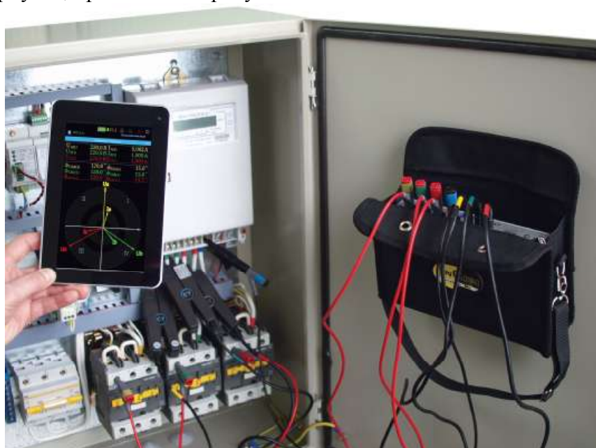
Рисунок 1 - Внешний вид приборного блока и планшетного компьютера

Внешний вид приборного блока и комплектов измерения тока с указанием мест нанесения знака утверждения типа и защиты от несанкционированного доступа в виде пломбировки корпусов, приведены на рисунках 1-7.