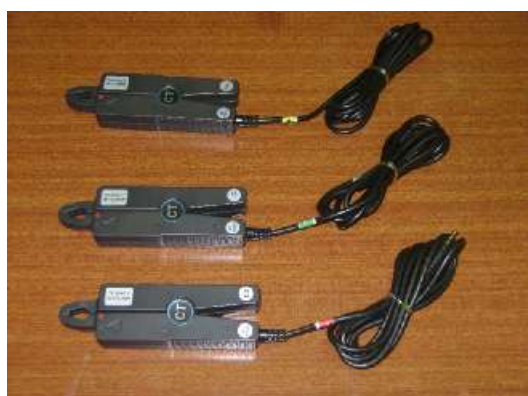
Рисунок 4 - Комплект измерения тока с токовыми клещами ТК-30АС-А (В, С) «/30АС»