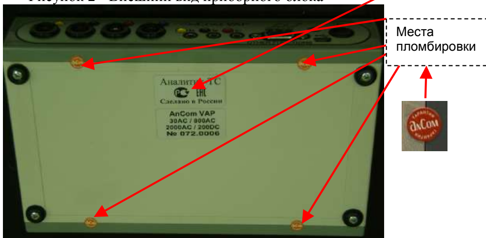
Рисунок 3 - Места пломбировки и нанесения знака утверждения типа на корпусе приборного блока