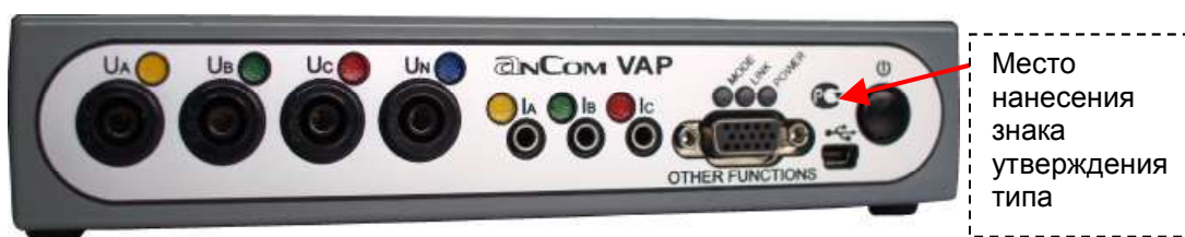
Рисунок 2 - Внешний вид приборного блока