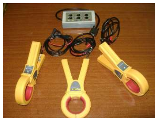
Рисунок 5 - Комплект измерения тока с токовыми клещами ТК-800АС-А (В, С) «/800АС»