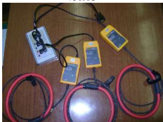
Рисунок 6 - Комплект измерения тока с токовыми клещами ТК-2000АС-А (В, С) «/2000АС»