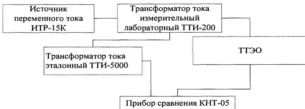
Рисунок 2. Схема для определения погрешности коэффициента масштабного преобразования и угла фазового сдвига силы переменного тока

4. Получают значения погрешности коэффициента масштабного преобразования и угла фазового сдвига с прибора сравнения КНТ-05.