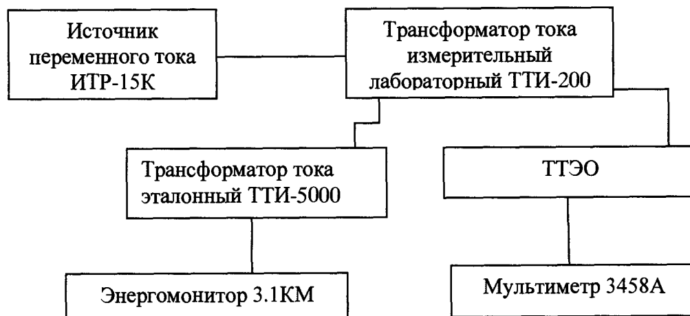
Рисунок 6. Схема для определения погрешности коэффициента преобразования силы переменного и постоянного тока

2 Воспроизводят испытательный сигнал с помощью источника в соответствии с таблицей 2.