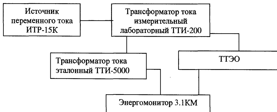
Рисунок 4. Схема для определения погрешности коэффициента преобразования силы переменного и постоянного тока

1. Собирают схему подключений согласно рисунку 1 (для силы постоянного тока) и схему по рисунку 4 (для силы переменного тока).