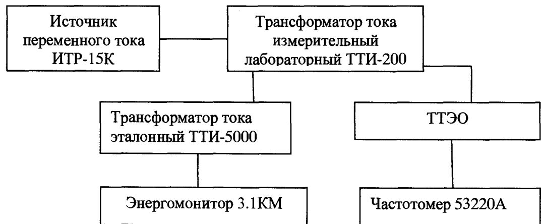
Рисунок 5. Схема для определения погрешности коэффициента преобразования силы переменного и постоянного тока

1 Собирают схему подключений согласно рисунку 1 (для силы постоянного тока) и схему по рисунку 5 (для силы переменного тока).