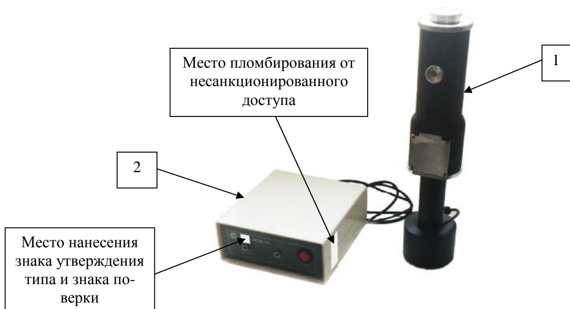
Рисунок 1 - Внешний вид базовой модели ИПМ-1А (1 – ударный преобразователь, 2- электронный блок АЦП)