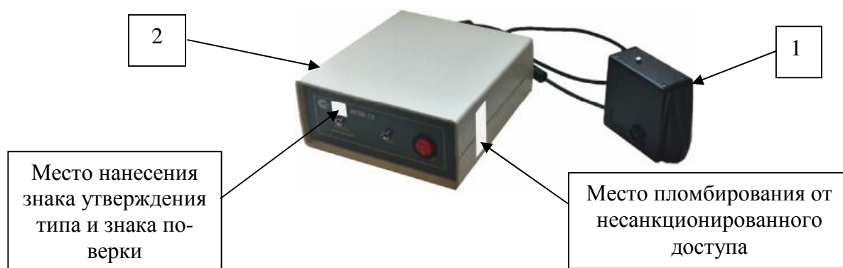
Рисунок 2 - Внешний вид базовой модели ИПМ-1К (1 – ударный преобразователь, 2- электронный блок АЦП)